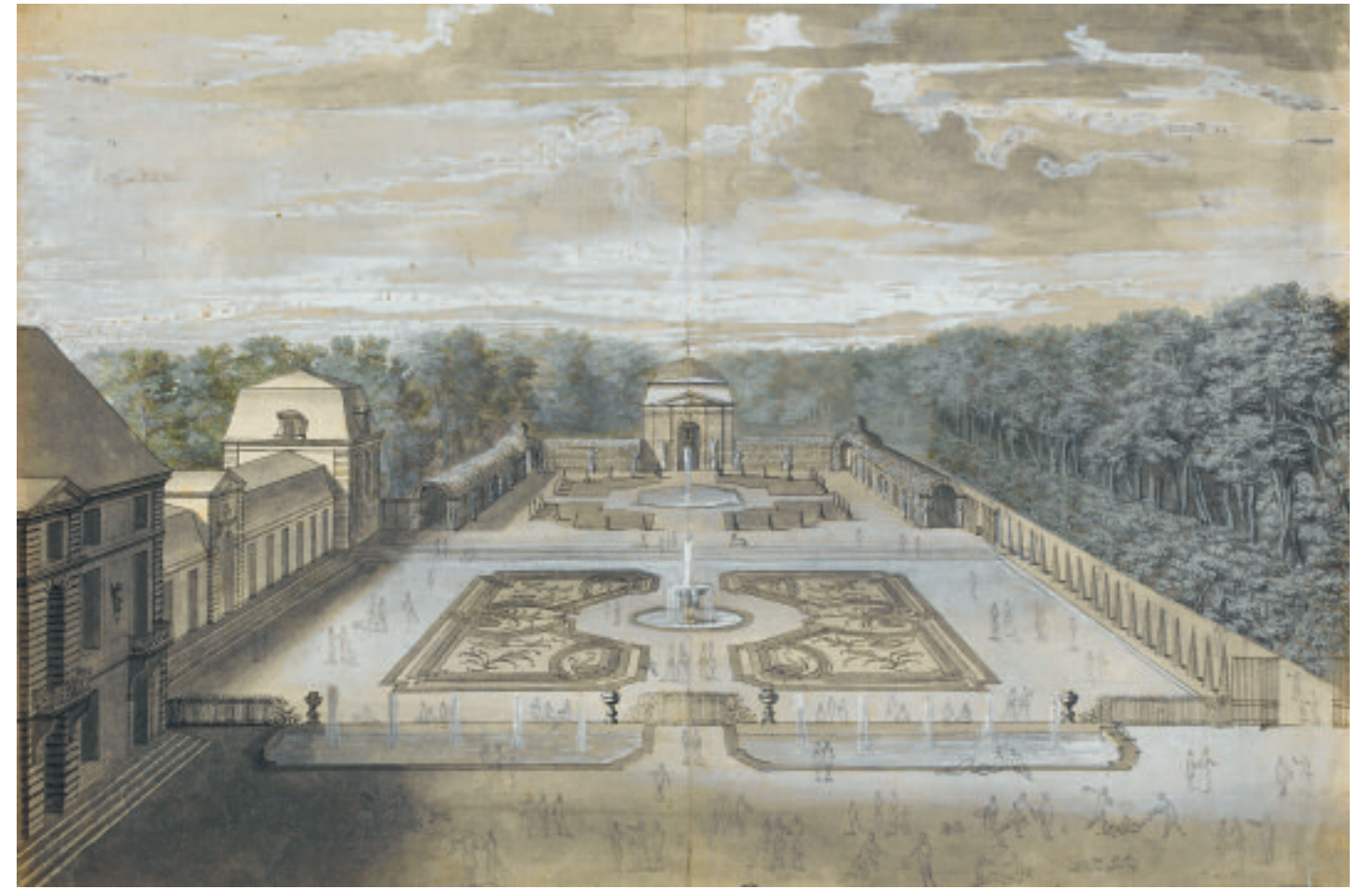
291. J.-B.-A. Le Blond (attrib. à), Vue de l'orangerie depuis l'ouest , fin du XVII e siècle, Paris, musée du Louvre. Ce dessin, préparatoire à la gravure, est ici inversé

les dates de construction de l'orangerie. A la fin de juillet ou au début d'août 1686, les ambassadeurs se rendirent à Sceaux une première fois et «virent une galerie que M. de Seignelay faisait bâtir dans son jardin et qui n'était pas encore achevée». Le bâtiment leur parut si beau qu'ils souhaitèrent le revoir lorsqu'il serait achevé. Ils revinrent à Sceaux le samedi 12 octobre, deux jours avant de partir pour les Flandres. La construction de l'orangerie, commencée en février, était donc achevée début octobre. Les marchés de travaux et le précieux récit de la visite des ambassadeurs du Siam se complètent pour donner une description précise de l'orangerie à l'époque de sa création 11 . Mais le plus étonnant est que, si les deux marchés de tra-